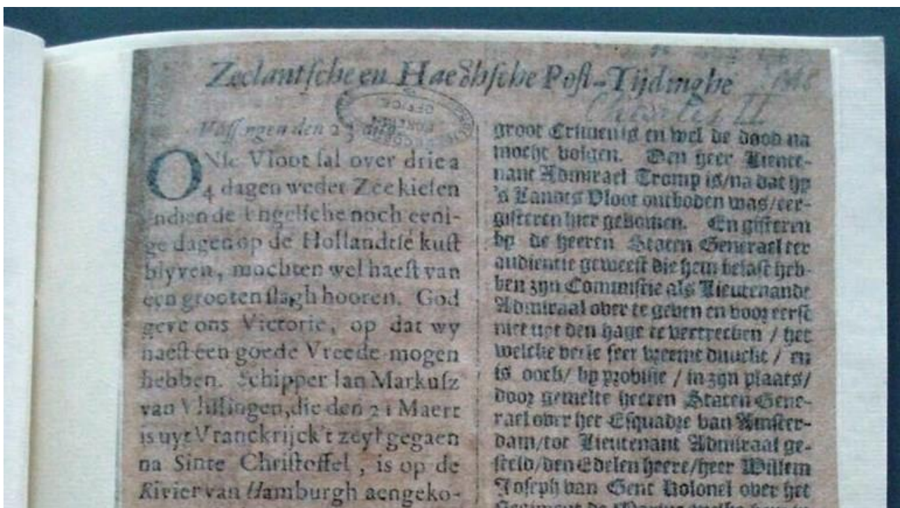
Oudste 'Zeelandse' krant opgedoken, uit 1666

De oudste krant van Zeeland is opgenomen in de Krantenbank Zeeland. Het gaat om verreweg de oudste Zeeuwse krant, de Zeelantsche en Haegsche Post-Tijdinghe van 27 augustus 1666.