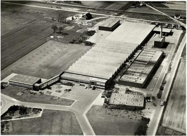
Foto 3a Het Tomadogebouw vlak na de opening.

Binnenkort te zien in de ExpoRuimte! Foto 2