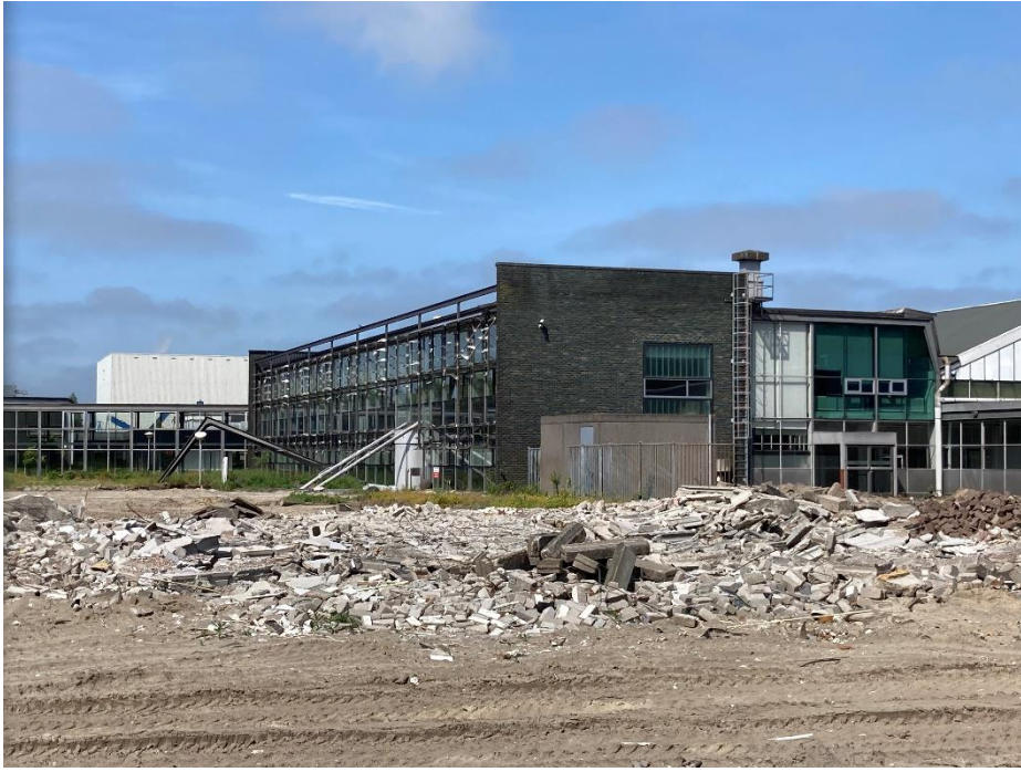
augustus 2021. Zicht vanuit de Heistraat. Bijna GESLOOPT! Foto 4